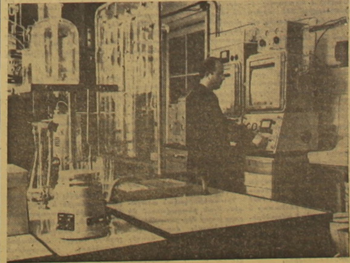
Քիմիական գրոցների և եզանակների արտադրանքային մշակման բաժանմունքում:

ընթացները կիրականացվեն նորագույն տեխնիկայի և սարքավորումների շնորհիվ: Ինստիտուտը, որ գտնվում է Կիրովի անվան քիմիական կոմբինատի տարածքում և ամենաանբար շրիման մեջ է արտադրության հետ, յայնօրեն հայտնի է Սովետական Միությունում: Նրա առաջարկած արտադրատեսակները որակով չեն զիջում արտասահմանյան լավագույն (Նաունհայրյունը՝ 2-րդ կում),