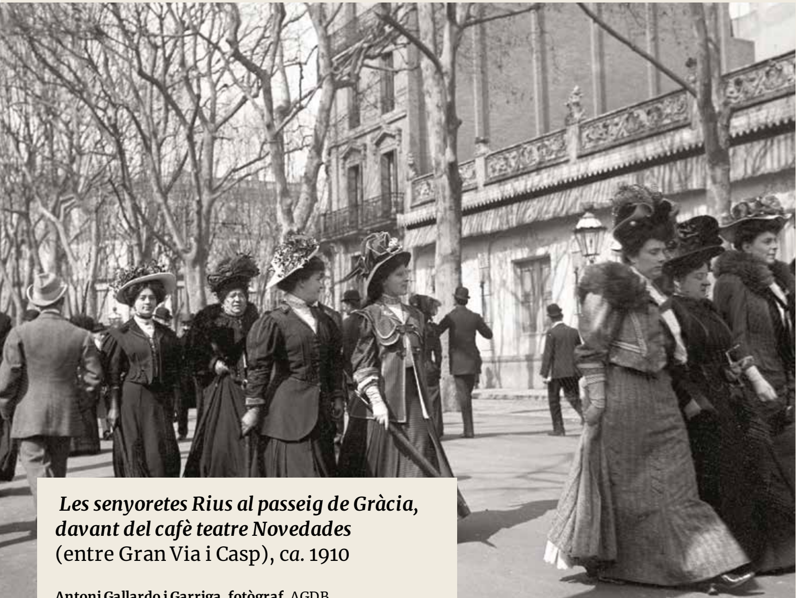
Les senyoretes Rius al passeig de Gràcia, davant del cafè teatre Novedades (entre Gran Via i Casp), ca. 1910